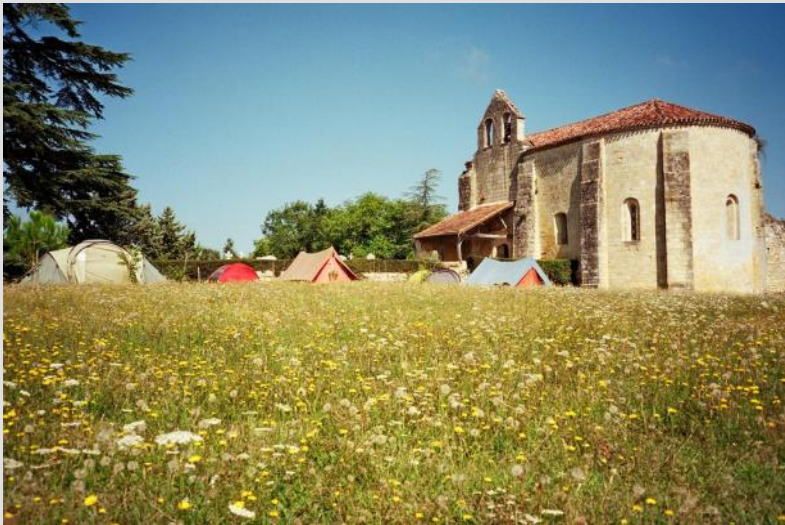
Le campement des jeunes au pied de l'église de Vopillon