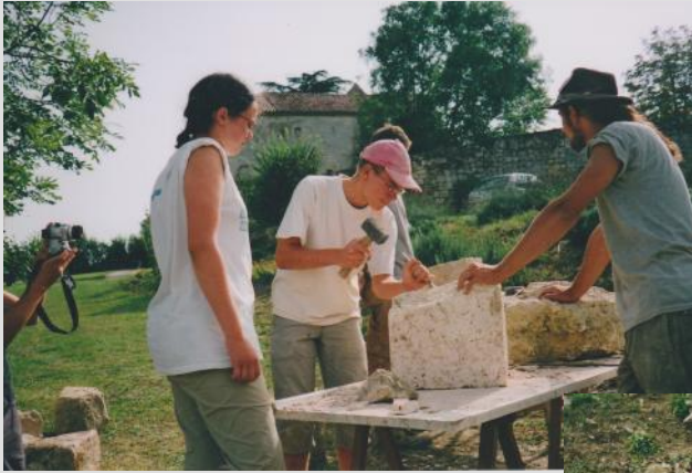
A l'école des tailleurs de pierre