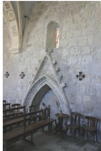
Enfeu ayant servi de sépulture