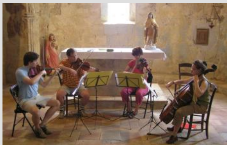
Le Quatuor à cordes Tamino en répétition