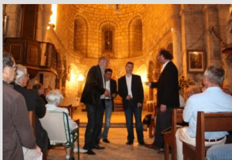
Le North Gospel Quartet à Mouchan