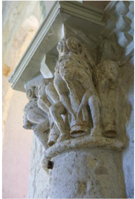
Chapiteau dans l'église de Gazaupouy