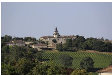
Le village de Gazaupouy

Partis du village de Gazaupouy dont nous avons pu utiliser les facilités de la salle des fêtes afin de