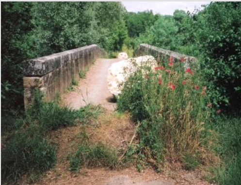
Le pont de Lartigue... avant

Par ailleurs, j'ai pas mal harcelé la Communauté des Communes pour la restauration du pont de Lartigue reliant les communes de Beaumont et Larressingle ... et cela pendant treize années... Les travaux se réalisèrent finalement courant 2016 et le pont fut inauguré en fin d'année.