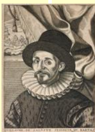
Guillaume de Saluste seigneur du Bartas