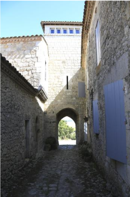
Porte Nord de Gazaupouy

chapiteaux romans ainsi que quatre enfeus qui ont servi de sépulture aux seigneurs locaux.