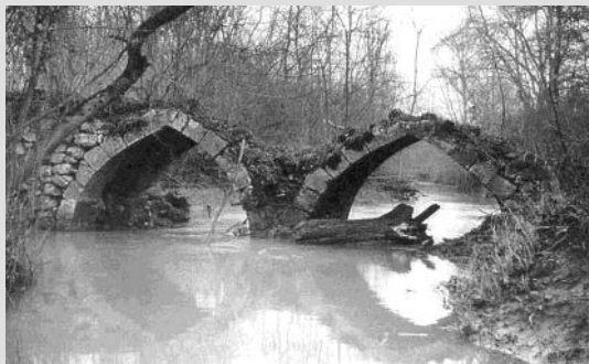
Le Pont de la Sablière tel qu'il était au milieu du XX e siècle

Il y a longtemps que je n'ai pas revu ce joli pont romantique, mais ce qu'il y a de certain, c'est que ce petit bijou continue son inexorable dégradation au fil du temps qui passe... et des intempéries.