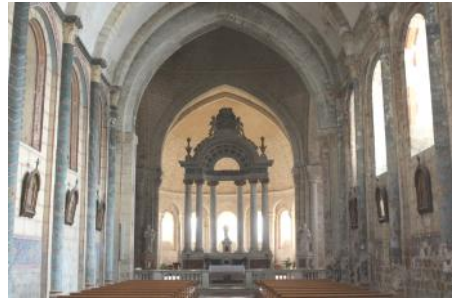
Saint-Martin de Layrac (Lot-et-Garonne)

Après le déjeuner, comme nous avions un peu de temps devant nous, nous avons décidé de faire un