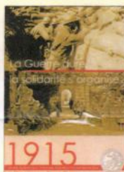
La Guerre dure, la solidarité s'organise