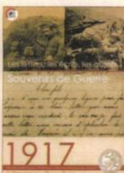
Les lettres, les écrits, les objets... Souvenirs de Guerre