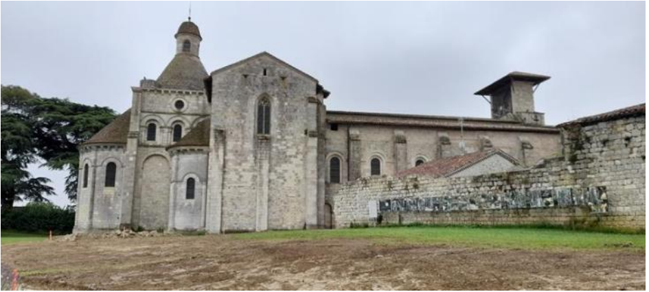
L'ancien Prieuré de Moirax (Lot-et-Garonne)

devant notre deuxième halte, le prieuré de Moirax .