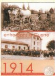
Le Gers entre dans la Guerre