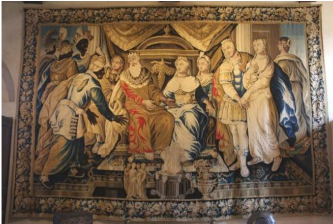
L'une des superbes tapisseries d'Aubusson à Gramont