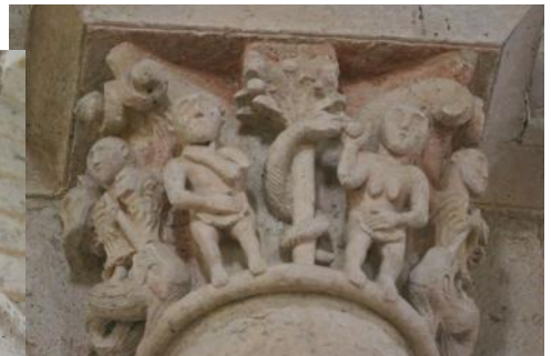
Adam et Eve et le serpent tentateur