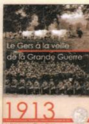
Le Gers à la veille de la Grande Guerre