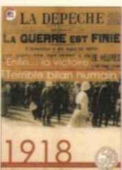
Enfin ... la victoire ; Terrible bilan humain (parution 2019)