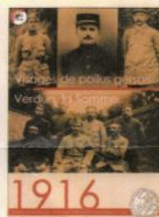
Visages de poilus gersois Verdun, la Somme...