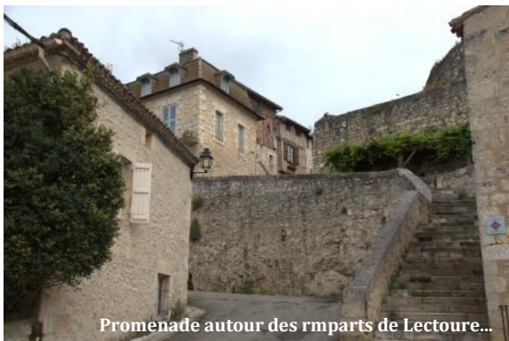
Promenade autour des rmparts de Lectoure...

qui protégeait la ville sur son extrémité est qui était la plus vulnérable. De là suivant la ligne extérieure des remparts jusqu'à la demi-lune, nous sommes parvenus à la Tannerie Royale dont nous avons admiré la délicate ferronnerie de la rampe de son escalier d'accès, mais aussi déploré l'état de délabrement dans lequel se trouvent ces bâtiments. Nous avons ensuite repris notre marche le long de la ligne extérieure de fortifications, avec tout d'abord un arrêt à la fontaine de Diane ou Hountélie, puis une longue marche le long des murailles du côté sud de la ville pour arriver enfin au château des Comtes d'Armagnac derrière l'hôpital créé au XVIII e siècle par l'évêque Claude François de Narbonne Pellet. Puis nous avons lentement gagné le restaurant du Bastard tout en cheminant, tantôt dans les ruel-