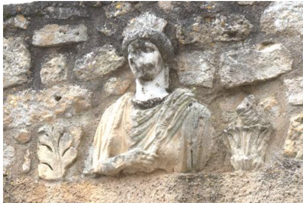
Remploi d'une statue romaine en pierre, tête en marbre, au-dessus d'une porte d'entrée moderne

les du centre pour voir l'église du Carmel, la Sénéchaussée, la tour d'Albinhac et les plus anciennes maisons de Lectoure, et tantôt le long des murailles du côté nord de la ville pour aboutir à la tour Corhaut et la rue de Corhaut où nous avons découvert des remplois de statues romaines dans les murs de maisons modernes.