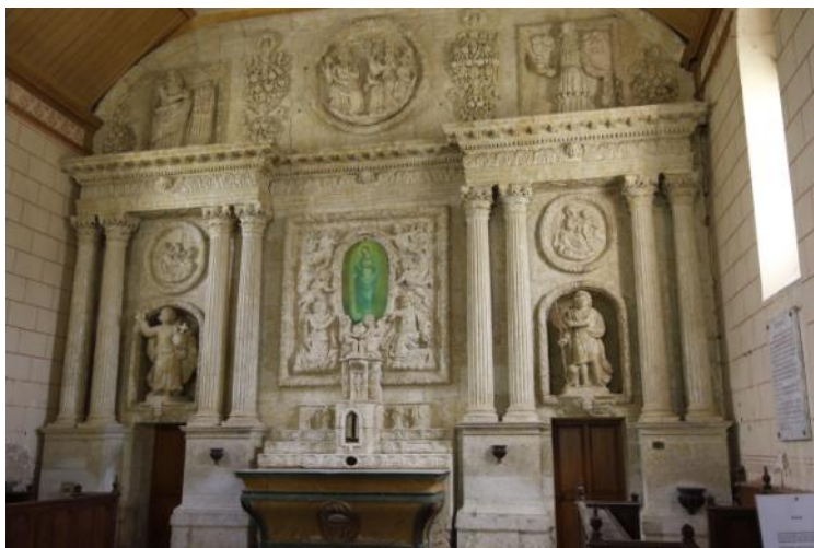
Retable en pierre de la chapelle de Latour. Le médaillon vert central est une photographie