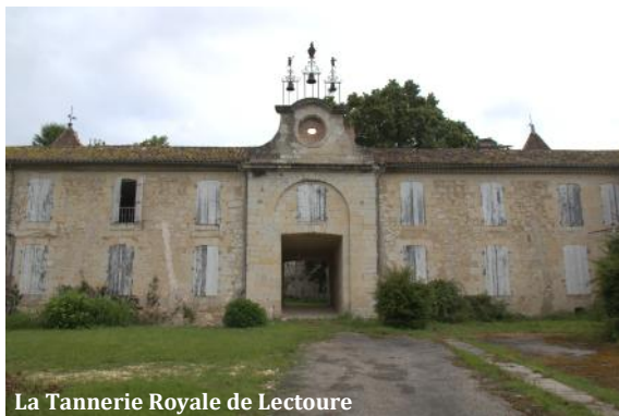
La Tannerie Royale de Lectoure

Par une grise matinée, le 16 juin, une quinzaine de membres d'Artiga se sont retrouvés à Lectoure pour explorer la ville. Notre promenade a débuté au Grand Bastion tout près de l'emplacement d'un ensemble très important de fortifications aujourd'hui disparu