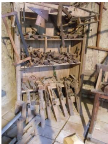
Anciennes varlopes et autres outils de menuiserie