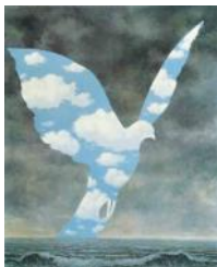
Colombe de la Paix de Magritte

C hers amis, Voici venu le moment de vous adresser nos vœux pour 2017. Je vous les formule personnellement avec émotion, car c'est la dernière fois que je le fais.