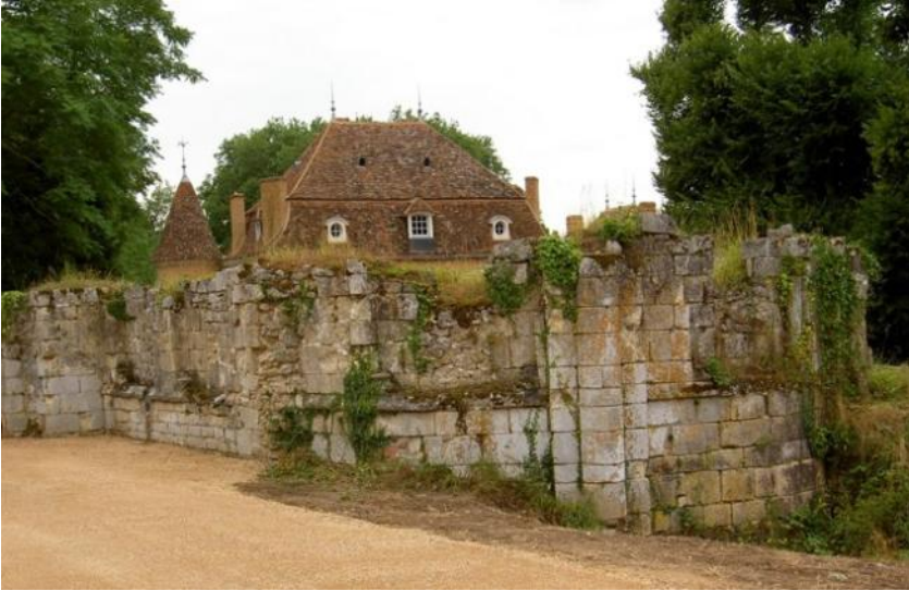
Priuré Notre-Dame de Longfont (Indre) de l'ordre de Fontevraud Siège de l'Association des Prieurés Fontevristes

Ce prieuré a été fondé en 1130, soit dix ans avant celui de Vopillon